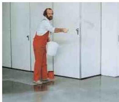
Посыпка свежего слоя грунтовки кварцевым песком.

Постепенно нанести раствор PCI® Eroxigrund 390 при помощи щётки на подготовленное основание. Немедленно после нанесения раствора обсыпать основание кварцевым песком (крупностью 0.3 - 0.8 мм в количестве 500 г/м 2 ). Покрытие можно наносить самое раннее через 8 часов.