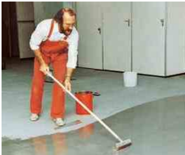
PCI® Epxigrund 390 наносится при помощи щётки на подготовленное основание.

Специальная грунтовка для впитывающих и невпитывающих оснований